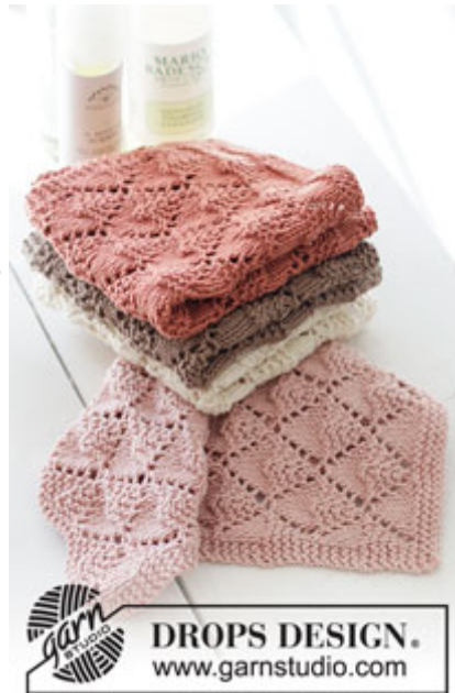
DROPS Extra 0-1491

Garnforbrug ved alternativt garn – Brug vores garn-omregner her